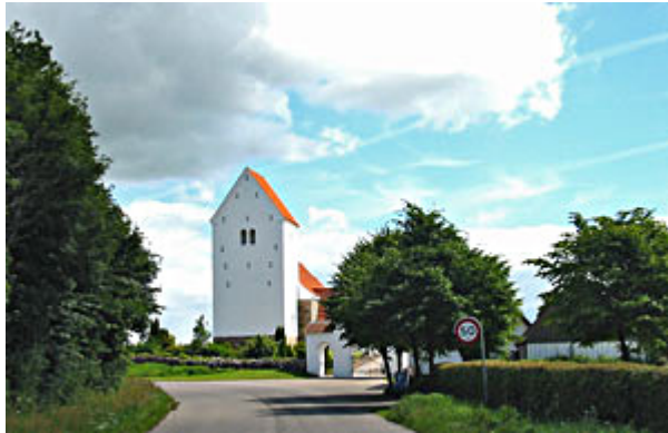
Øster Starup Kirke

stort. Kirken var fyldt med folk fra nær og fjern, som ville vise den amerikanske pilot den sidste ære i taknemmelighed over den indsats, som bl.a. han havde gjort for bekæmpe nazismen.