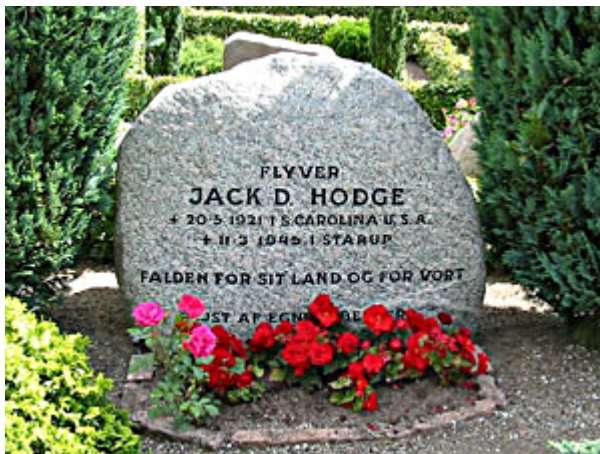
Gravsten rejst af egnens beboere